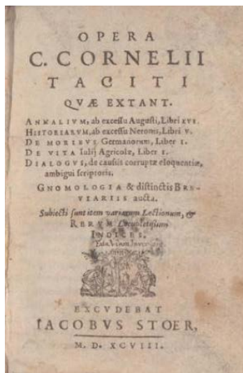
Tacite, Opera , Genève, Jacob Stoer, 1598.