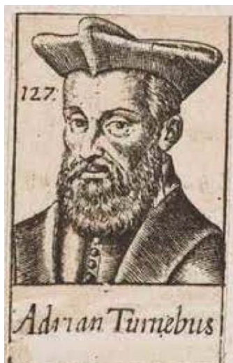
Portrait original d'Adrien Turnèbe, conservé à l'université de Louvain.