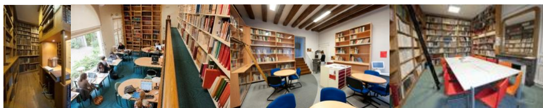
Le fond ancien