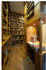
Le fond ancien