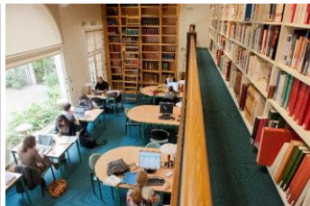
La salle de lecture