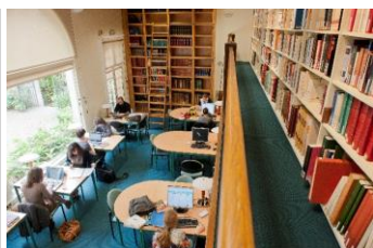
La salle de lecture