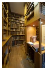
Le fond ancien