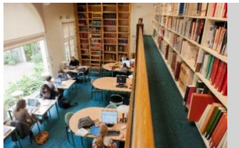
La salle de lecture