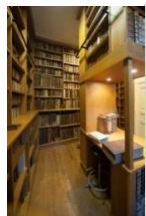
Le fond ancien