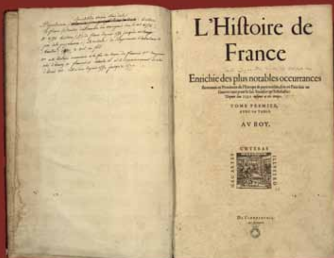
Page de titre du premier volume de L'Histoire de France (1581) © Médiathèque François Mitterrand - Poitiers, AP 121, cliché O. Neuillé

21 et 22 octobre 2010 Médiathèque François Mitterrand - POITIERS