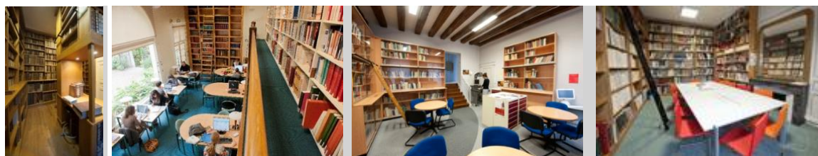
Le fond ancien