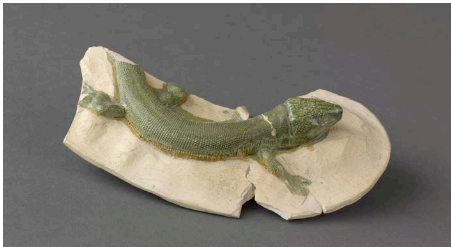
Bernard Palissy, Lézard, 3 e quart du XVI e siècle, terre cuite glaçurée. Écouen, musée national de la Renaissance (EP 518)